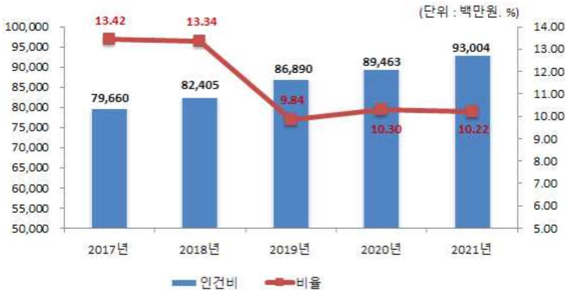
인건비 연도별 변화